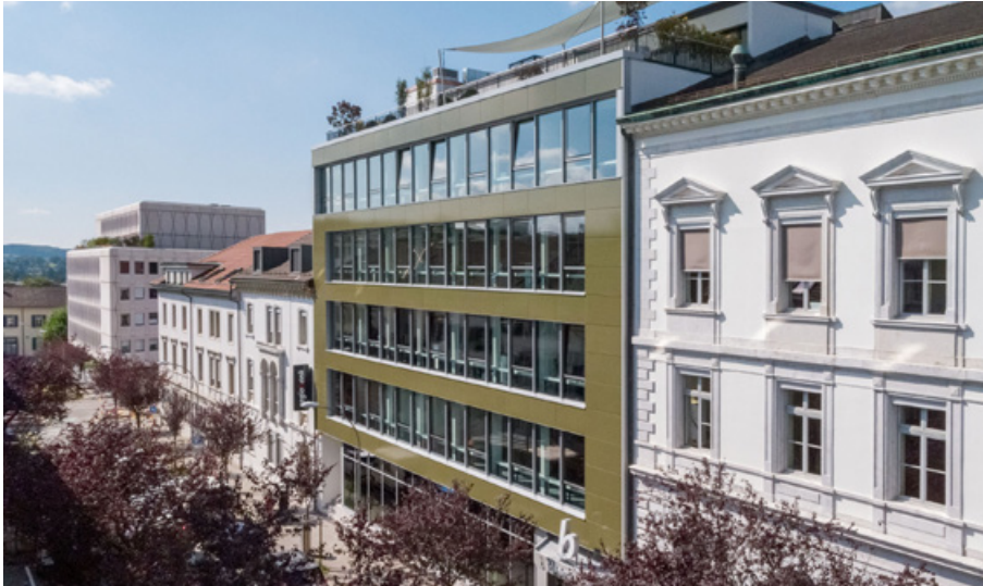
Die zwei verbundenen Gebäude an der Westbahnhofstrasse.