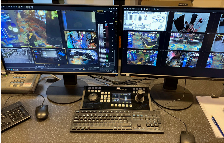
Jede/r Mitarbeitende kann im SIAXMA® System seine Benutzeroberfläche individuell konfigurieren.

niert. Wir konnten uns in Locarno voll und ganz auf das Casino-Team verlassen. Dessen gute Kenntnisse der bestehenden Anlage, des Gebäudes und der gesetzlichen Anforderungen halfen uns, zielgerichtet und effizient zu planen und umzusetzen. Man stelle sich vor: Die neue Videoüberwachung haben wir parallel zur alten aufgebaut, ohne je einen Unterbruch zu haben.